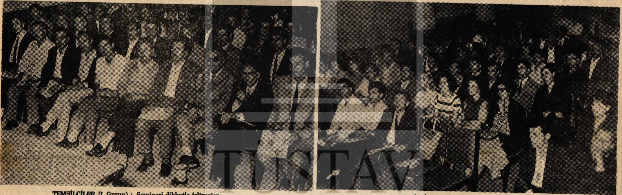
TEMSİLCİLER (I. Grup) : Semineri dikkatle izliyorlar..