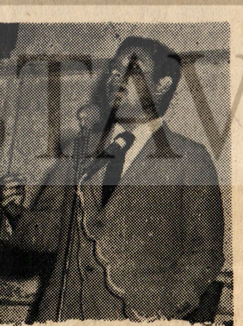
AV. ERDAL EGEMEN: İş ahlakı..